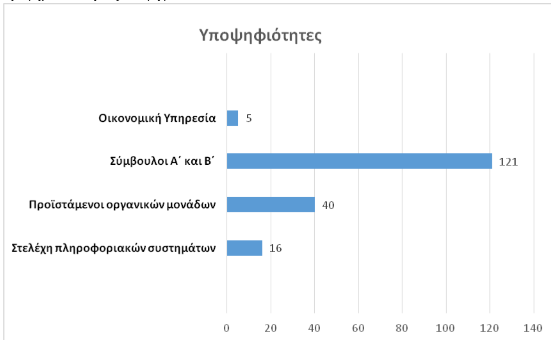
Γράφημα 1 Αιτήσεις υποψηφίων